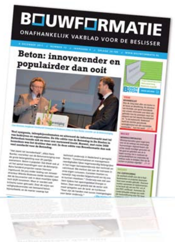
Bouwformatie is zowel in print als digitaal beschikbaar.